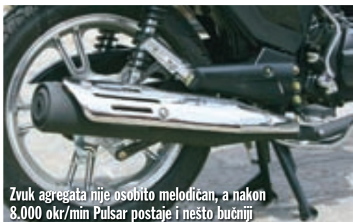
Zvuk agregata nije osobito melodičan, a nakon 8.000 okr/min Pulsar postaje i nešto bučniji

Osim tih vibracija, ocjenu za ukupnu udobnost donekle spušta i izvedba sjedala, koje je toliko mekano da je premekano, odnosno ne može kvalitetno amortizirati udar-