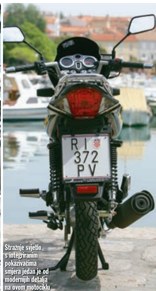
Stražnje svjetlo s integriranim pokazivačima smjera jedan je od modernijih detalja na ovom motociklu