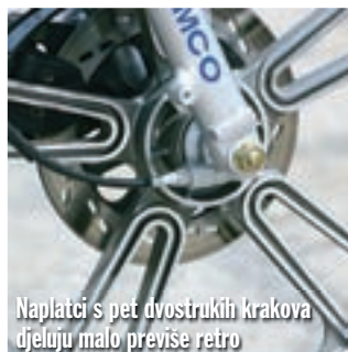
Naplatci s pet dvostrukih krakova djeluju malo previše retro