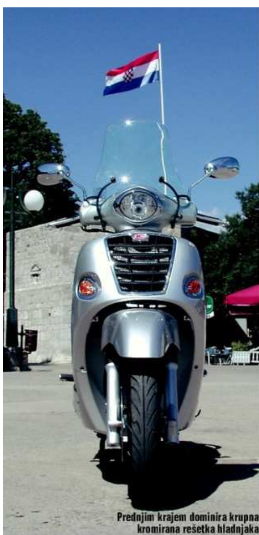
Prednjim krajem dominira krupna kromirana rešetka hladnjaka