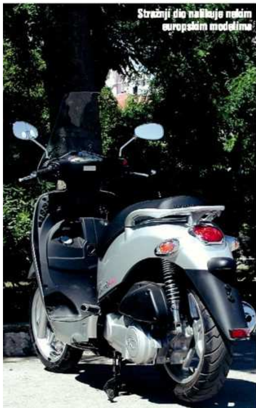
Stražnji dio najbliže nekim europskim modelima

People 250 odlikuje klasična skuterska koncepcija visokih kotača, a talijanski "štih" u dizajnerskom smislu i pouzdan Kymcov četverotaktni agregat čine ovu kombinaciju dobrom alternativom europskim markama