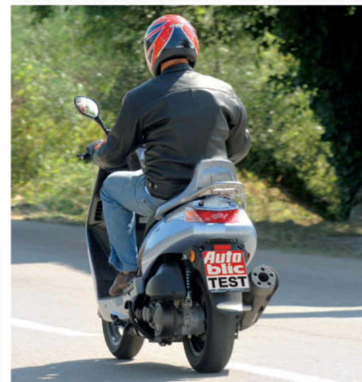
■ Motor obujma 175 ccm agilno tjera kymco čak i kad ga voze korpulentniji vozači (gore). Bočni i glavni nogari serijska su oprema, kao i aluminijski nogari za suvozača (dolje)