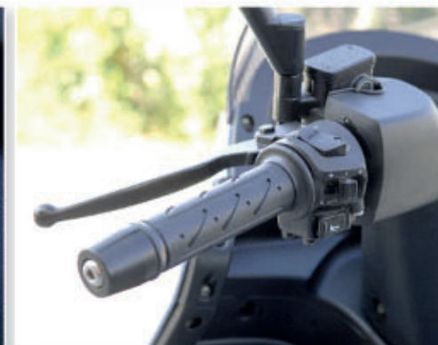
■ Kvalitetna izrada primjećuje se na svakom detalju (gore), a zanimljivo su oblikovana i stražnja svjetla i ispušni lonac (dolje)