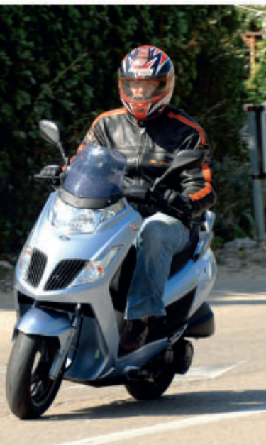
■ Zanimljivo oblikovan prednji kraj new dinka djeluje originalno i upečatljivo (gore). Lijepo stiliziran ususnik zraka pokraj svjetla (dolje)