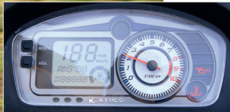
■ Kvalitetno izvedeni detalji i pregledna instrumentna ploča u digitalno-analognj izvedbi (gore). Dobrodošao detalj: suvozač ima oslonac za više udobnosti. Ispod sjedala stane integralna kaciga (dolje)